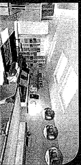
Corso Magenta - Vendita

In stabile depoca di grande fascino, ampia metratura distribuita su due livelli. Piano alto e affacci riservati per una dimora di sicuro charme, con possibilità di box. Classe energetica G - IPE 175 Kwh/m 2 anno.