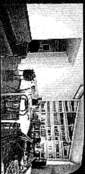
Porta Ticinese - Vendita

In stabile d'epoca, all'ultimo piano con ascensore, abitazione di 135 mq di nuova realizzazione. Spazi funzionali e dotazioni all'avanguardia, nel quartiere più esclusivo del centro storico. Classe energetica A2 - IPE 72,87 Kwh/m 2 anno.