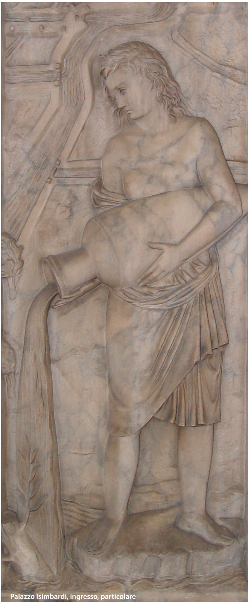
Palazzo Isimbardi, ingresso, particolare