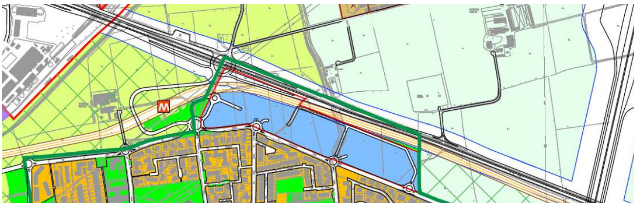
Variante 2017: Estratto Tav 2 "Tavola delle Previsioni di piano" (vigente)